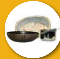
ماهیتابه و قابلمه های فلزی