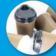
کاپ های قهوه