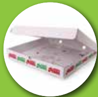
جعبه های پیتزای استفاده شده