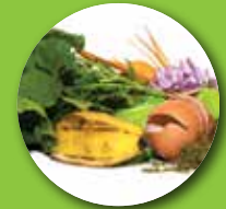
پس مانده های غذایی شامل گوشت، استخوان، بوست تخم مرغ و لبنیات