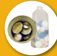
سر پوش های فلزی و پلاستیکی (قرار داده شده در ظروف فلزی یا پلاستیکی)