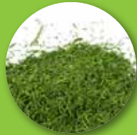
چمن کوتاه شده