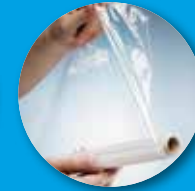
نایلون بسته بندی و کاغذ مومی