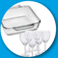
ظروف شیشه ای ضد حرارت