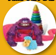
اسباب بازی های پلاستیکی