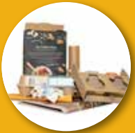
کاغذ و مقوا