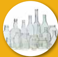
بطری های شیشه ای و شیشه های دهان کشاد