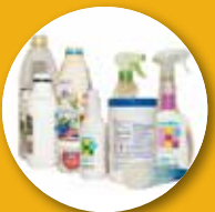
بطری های و ظروف ساخته شده از پلاستیک سخت