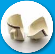
ظروف چینی شکسته