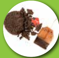
نقاله قهوه و چای کیسه ای مصرف شده