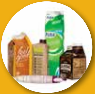
جعبه های کارتنی