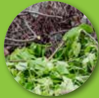
شاخ و برگ درختان