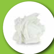
Fazzoletti di carta e carta da cucina