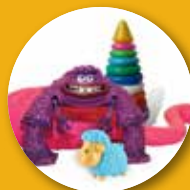
Giocattoli di plastica