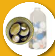
Coperchi di metallo e di plastica (da mettere nei contenitori di metallo/plastica)