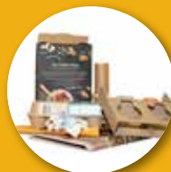
Carta e cartone