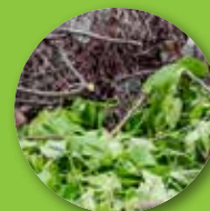
Rami e foglie