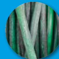
Corde e tubi