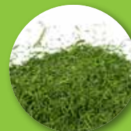
Ritagli di erba