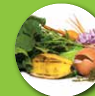
Umido da cucina (compreso carne, osse, gusci d'uovo e latticini)