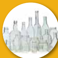
Bottiglie e barattoli di vetro