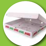
Scatole d'asporto sporche per pizza