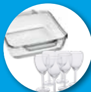
Cristalleria resistente al calore